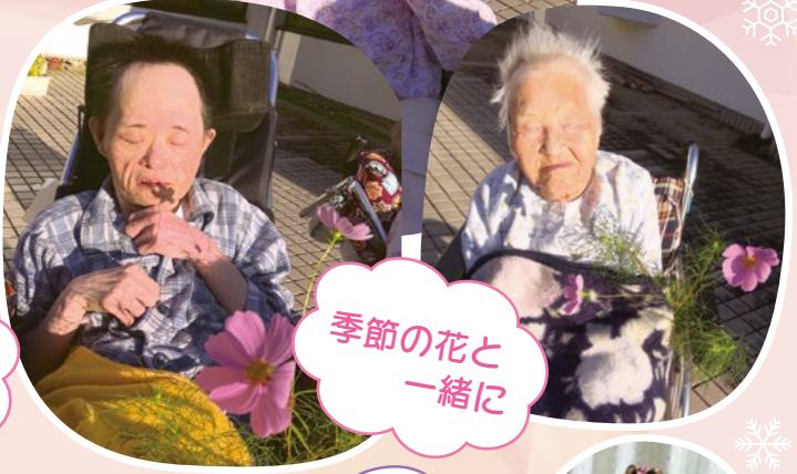
季節の花と一緒に