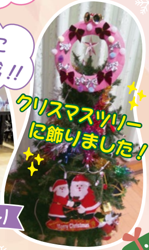
クリスマスツリーに飾りました!