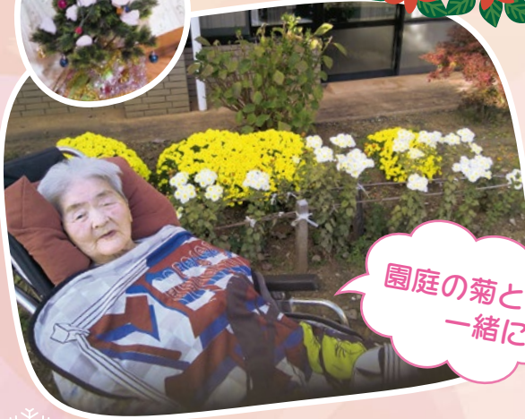
園庭の菊と一緒に